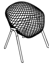
KOBI CHAIR *