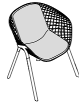
KOBI PAD MEDIUM