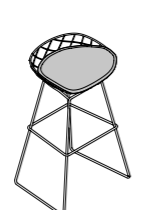
KOBI HIGH STOOL