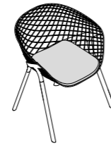
KOBI PAD SMALL