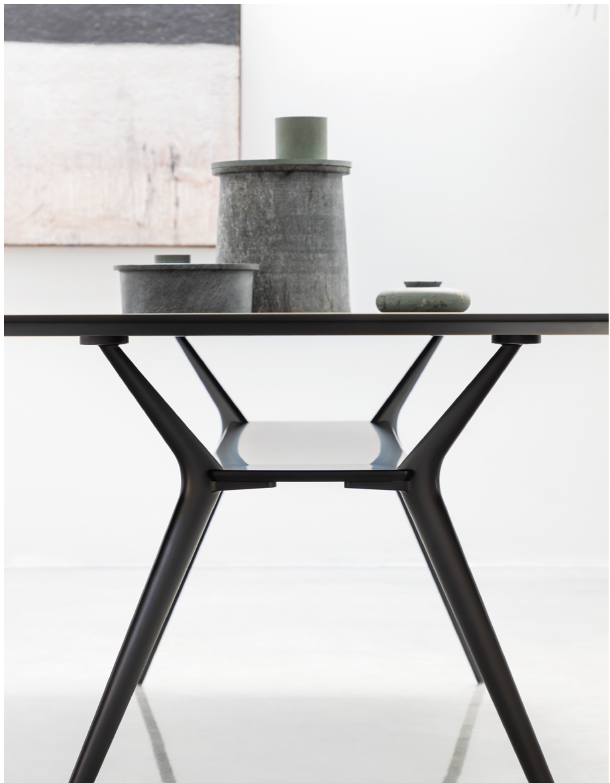
BIPLANE Alberto Meda