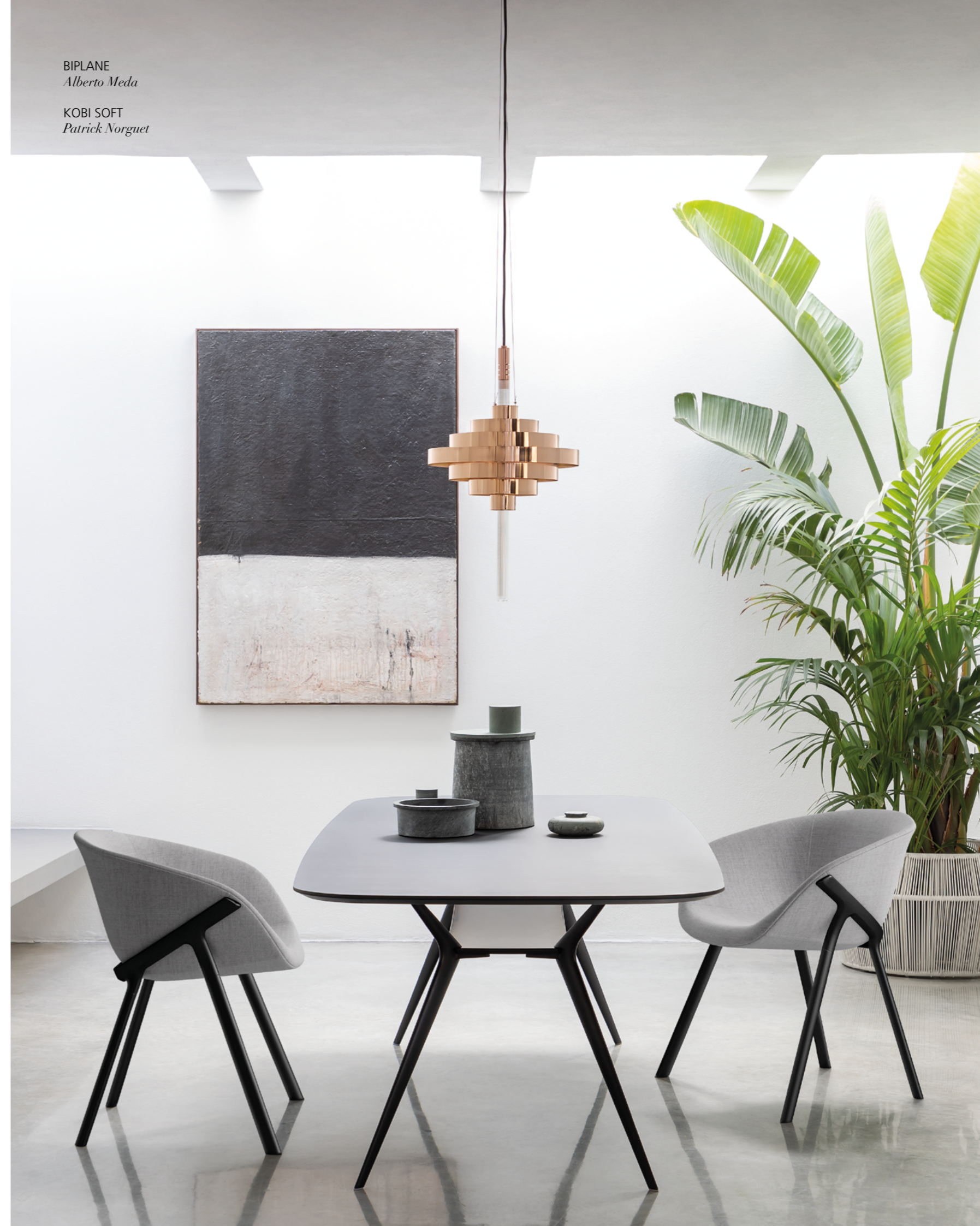
KOBI SOFT Patrick Norguet