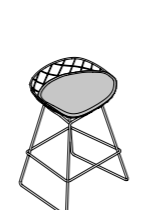
KOBI MEDIUM STOOL